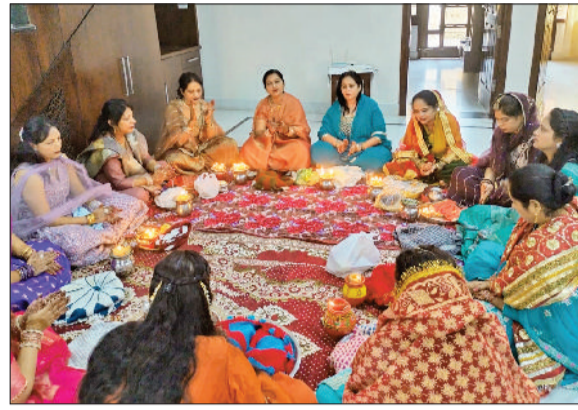
सीवन। करवा चौथ पर कथा सुनती महिलाएं