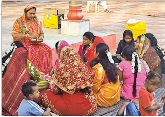
जीद। जयंती देवी मंदिर में कथा सुनती महिलाएं।

शहर के बाजारों में शुक्रवार को सुबह के समय खासी भीड़ रही। सुबह सुहागिन महिलाओं ने पति की लंबी उम्र के लिए व्रत रखा। दोपहर को करवा माता की कथा सुनी और उसके बाद जलपान किया। रात में चांद निकलने के बाद ही सुहागिनों ने छलनी से पति और चांद के दर्शन करने के बाद अपने व्रत खोले। इस मौके पर पतियों ने अपनी पलियों को शानदार गिफ्ट भी दिए। शहर के बाजारों में करवा चौथ को लेकर खरीददारी का दौर दिन भर चलता रहा। वहीं जैसे ही महिलाओं ने चांद को देख कर व्रत को पूरा किया तो शहर के ढाबों व होटलों पर खाना लेने के लिए लंबी लाइनें लग गईं।