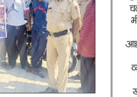
कैथल। ग्रामीणों को जागरूक करते पुलिस कर्मचारी।