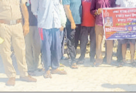
कैथल। ग्रामीणों को जागरूक करते पुलिस कर्मचारी।