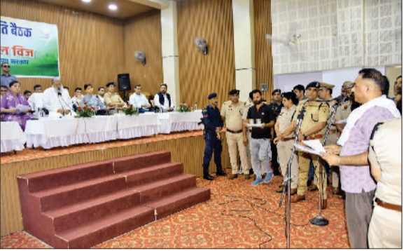
कैथल। मंत्री अनिल विज जिला कष्ट निवारण समिति की बैठक में शिकायत सुनते।