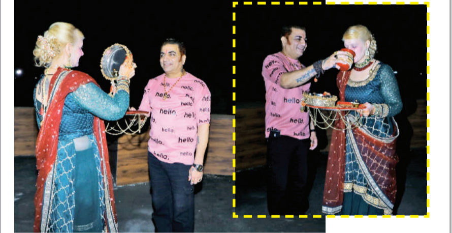
जाँद। जिले में शुक्रवार को करवा चौथ का त्योहार धूमधाम से मनाया गया। सुहागिनों ने दिनभर निर्जला व्रत रखा। मौसम साफ होने के कारण रात्रि 8 : 15 के बाद ही चांद का दीदार हुआ। शाम को चांद को अर्घ्य देकर पति की दीर्घायु की कामना करते हुए व्रत खोला। दिनभर महिलाएं सजी संसरी रहीं। बाजारों में भी खूब खरीदारी हुई।