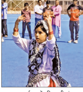
नरवाना। कार्यक्रम में हरियाणवी डांस प्रस्तुत करती हुई एक बालिका।