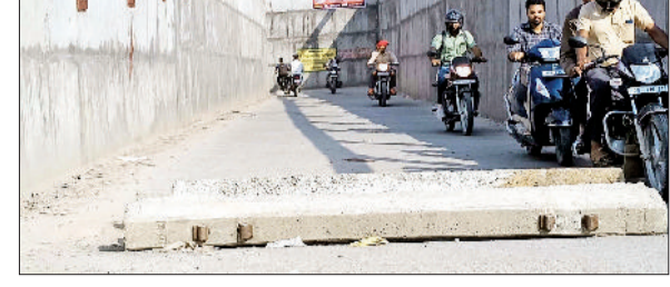
जींद। रेलवे विभाग द्वारा पत्थर डालकर अस्थायी अवरोधक।