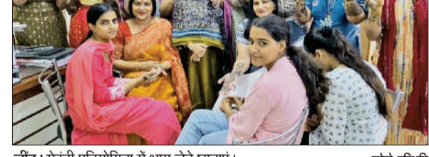
जींद। मेहंदी प्रतियोगिता में भाग लेते छात्राएं।