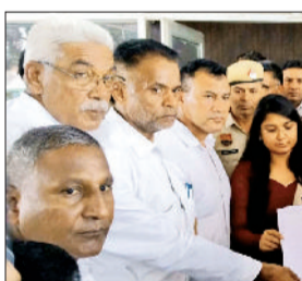
जींद। मांगों को लेकर सीटीएम को ज्ञापन सौंपते कार्यकर्ता।